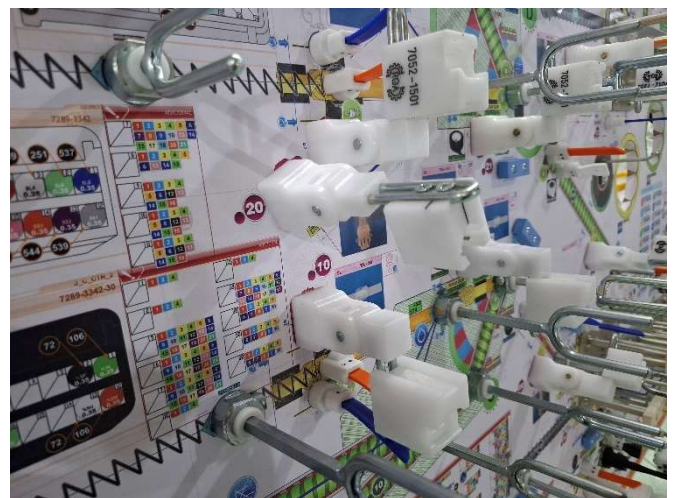
4 - Elementos mistos