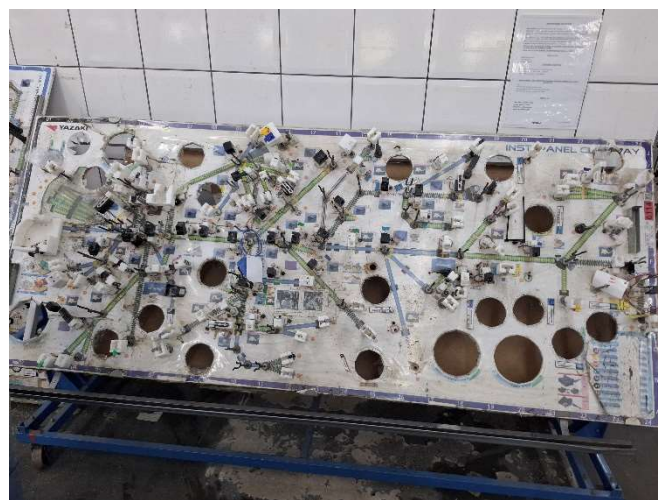
6 - Painel finalizado