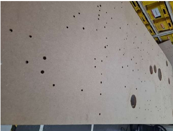
1 - Chapa em MDF