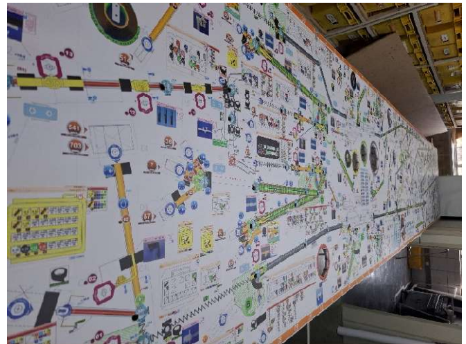
2 - Lona de impressão